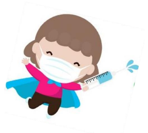
Rocío Villablanca Valeria. 7° básico.

Se despide de ustedes, Agente Secreta ROCIO UVE-UVE.